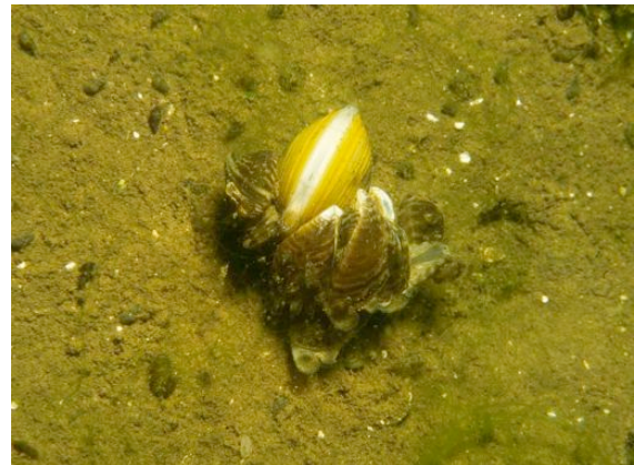
Körbchenmuschel mit Dreikantmuschel

biologischen Station in Wesel. Man hört von deren Aktivitäten in erster Linie im Zusammenhang mit Gänsen oder anderem Federvieh. Aber das Interesse für seltene und schützenswerte Arten, die es unter Wasser so gibt, das haben sie auch. Da geht es um Bitterlinge, Neunaugen usw. Ein spezielles Interesse gilt den Großmuscheln in unseren Gewässern. Welche Arten gibt es überhaupt noch, wo gibt es sie und in etwa in welcher Menge. Da sind die Entenmuschel, die große Teichmuschel oder die abgeplattete Teichmuschel, teilweise nur vom Experten zu unterscheiden.